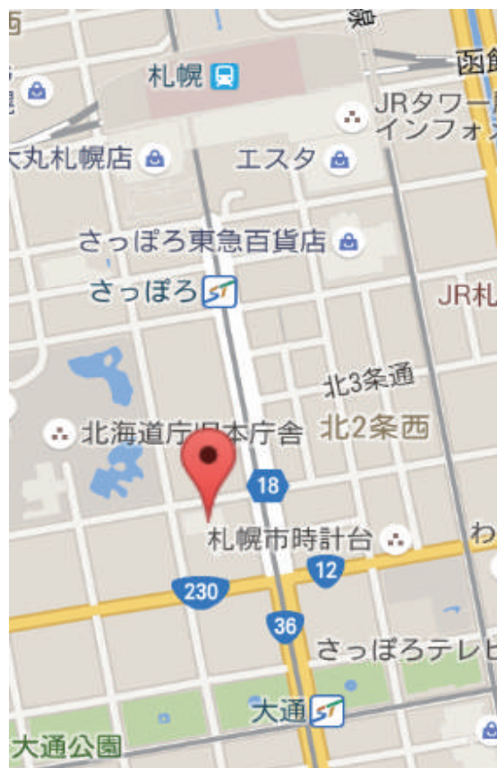
図：札幌グランドホテルへのアクセス