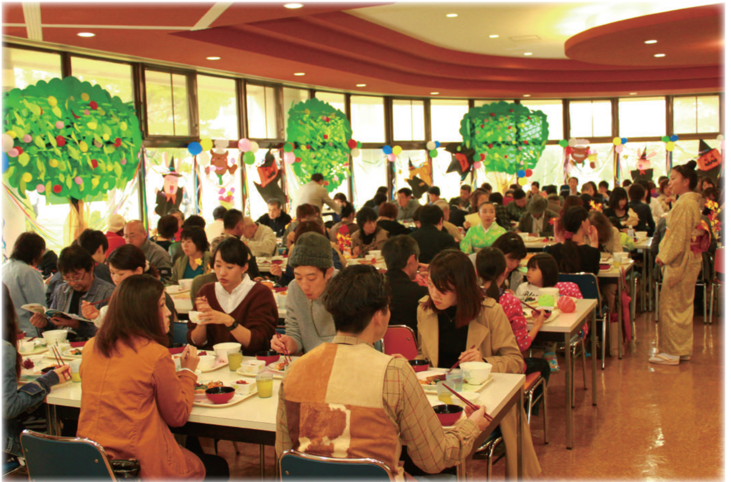
写真：OB・OG 給食レストランの様子